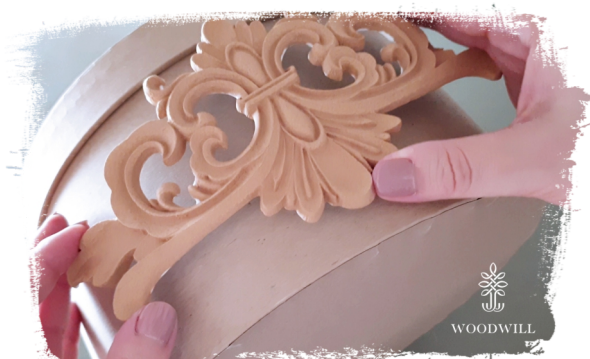
Trin 5: placer den (varm op og bøj om nødvendigt)