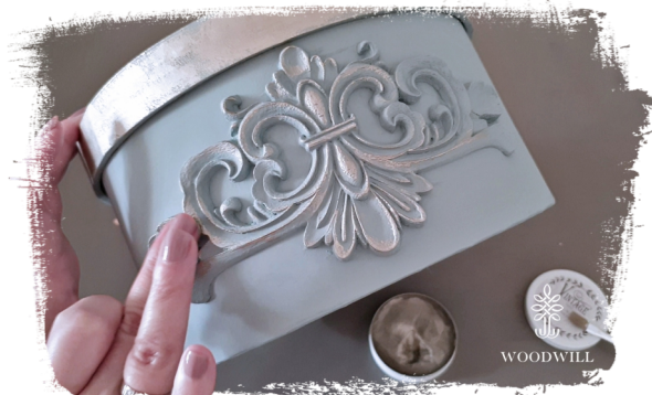
Trin 8: Marker det med dekorativ voks, hvis du ønsker