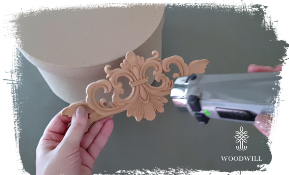
Trin 1: Varm hele ornamentet op