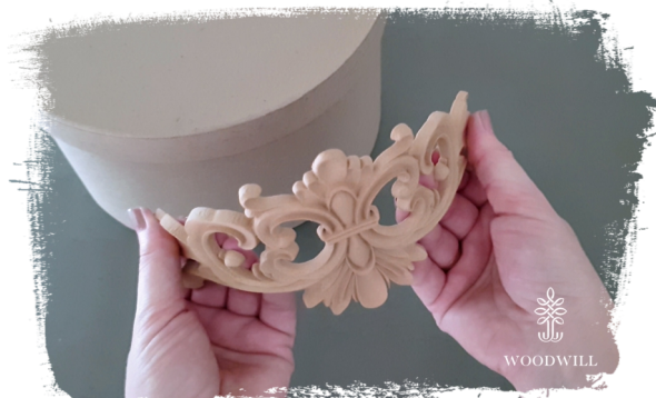
Trin 2: Form den, mens den er varm