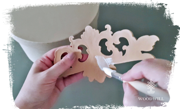
Trin 4: fordel limen