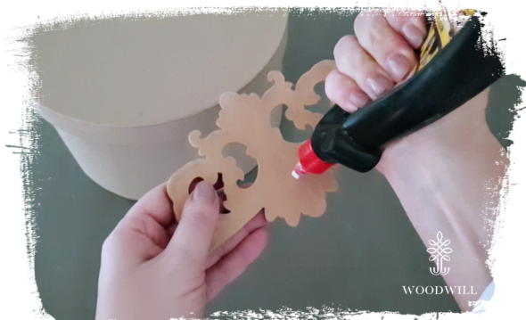
Trin 3: påfør trælim