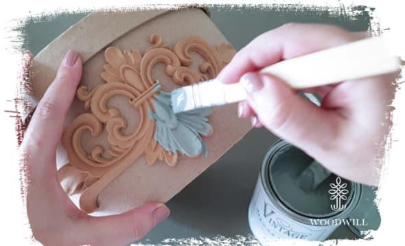
Trin 7: mal det i enhver farve, du ønsker